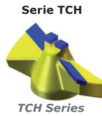
Serie TCH TCH Series