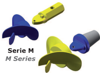
Serie M M Series