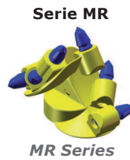
Serie MR MR Series